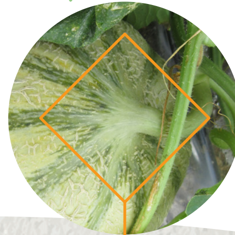
Jaunissant non cerné